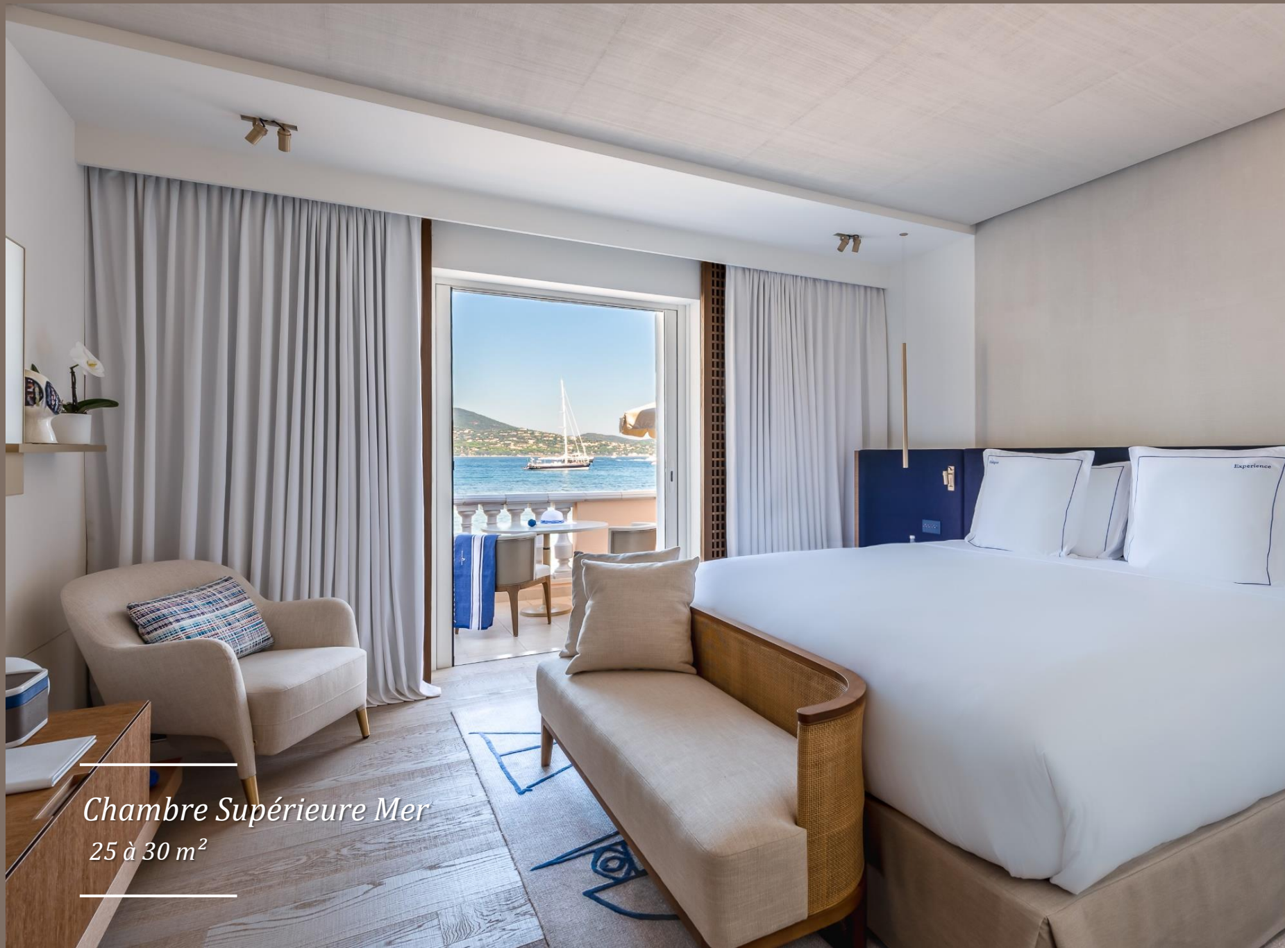
Chambre Supérieure Mer 25 à 30 m 2