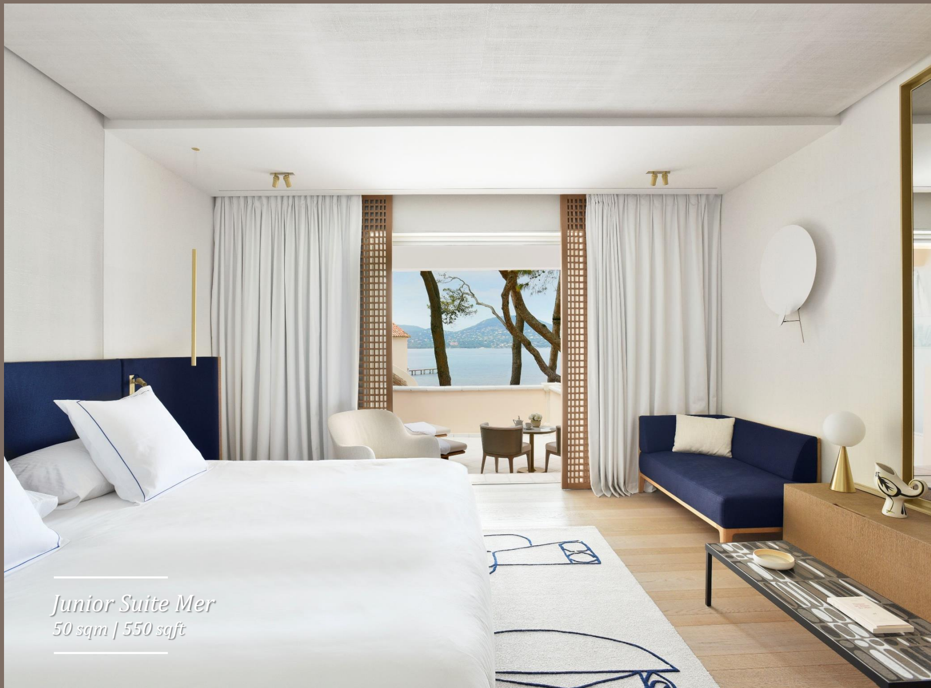
Junior Suite Mer 50 sqm | 550 sqft